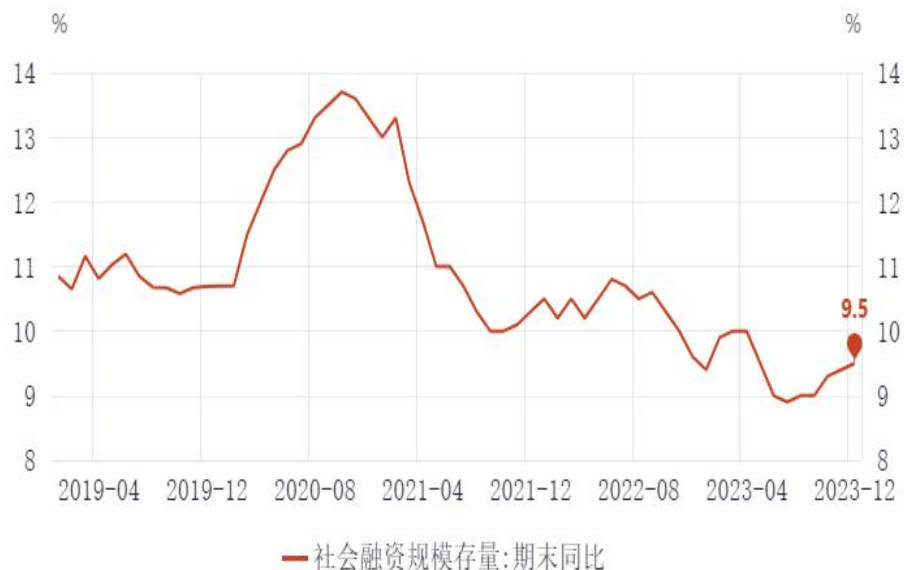
图1：社融规模存量增速