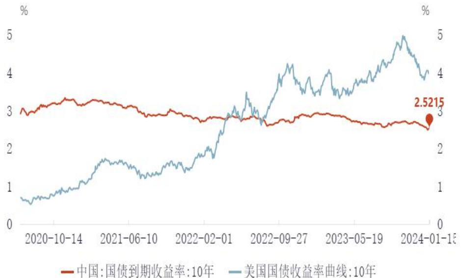
图3：中、美十年期国债上海同业拆借3月