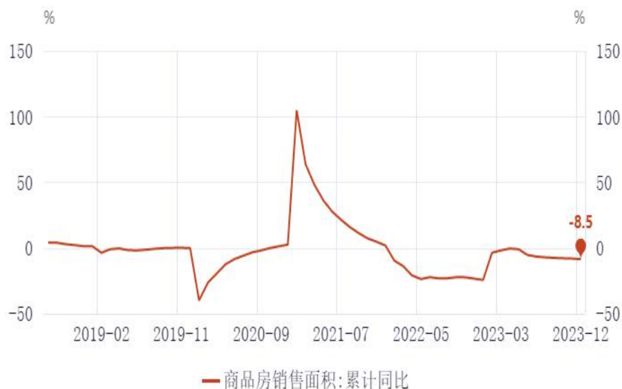
图9：商品房销售面积累计同比