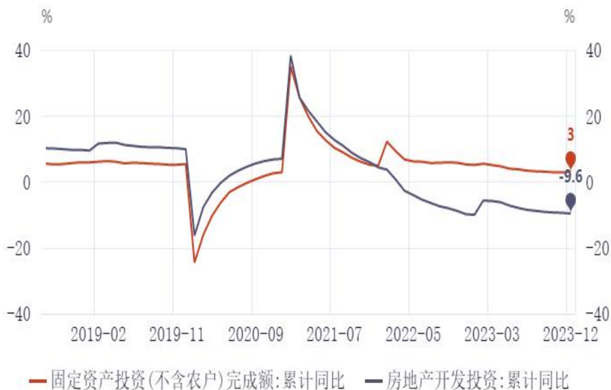
图11：固定资产投资累计同比