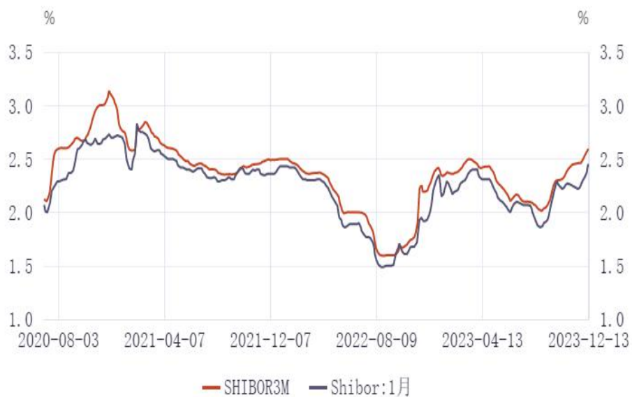
图2：上海同业拆借3月