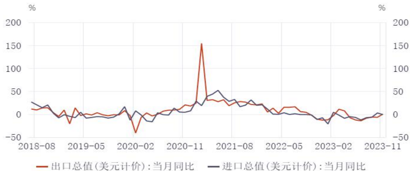
图12：美元价进出口同比

按美元计价，今年11月份，我国进出口5154.7亿美元，与去年同期持平。其中，出口2919.3亿美元，增长0.5%，前值-6.4%；进口2235.4亿美元，下降0.6%，前值3%；贸易顺差683.9亿美元，扩大4%。