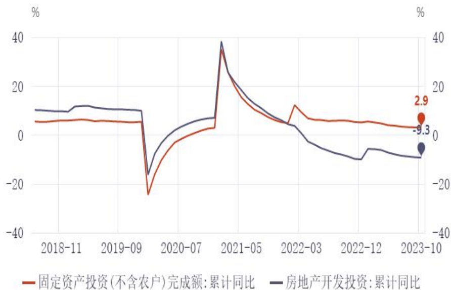
图10：固定资产投资累计同比