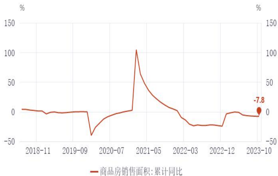
图8：商品房销售面积累计同比